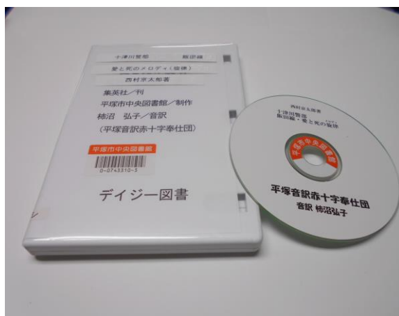
↓ デージー図書 (中央図書館所蔵)