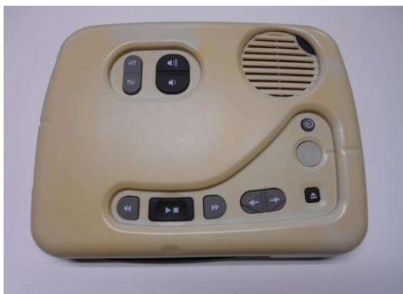
↑ 専用の再生機 (プレクストーク) (中央図書館・館内利用のみ)